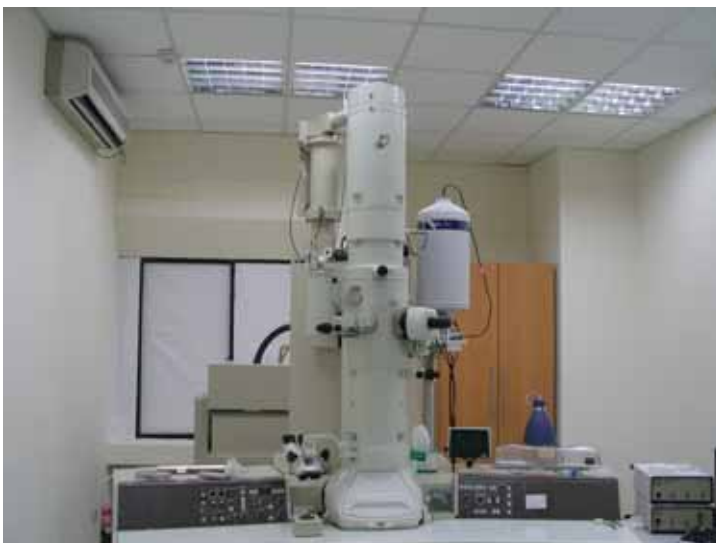
本系新購之 TEM 型號: JEOL JEM-2010 位於物 426