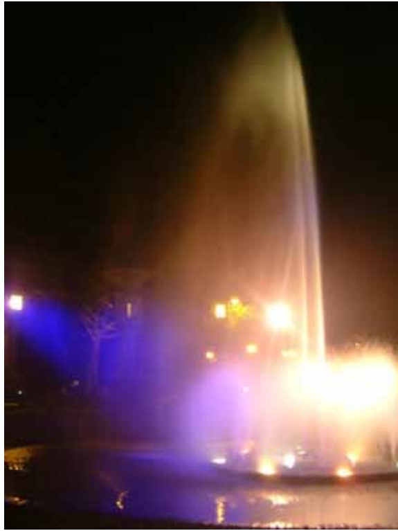
噴水池新安裝照明設備後的夜景