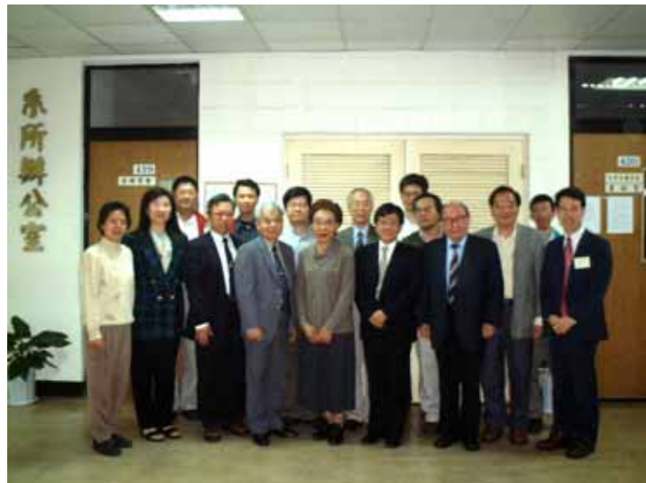
化學學門評鑑與本系教師合照 93.12.06