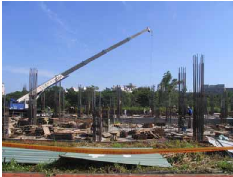
大學部新宿舍工程 (94.09.03 攝)