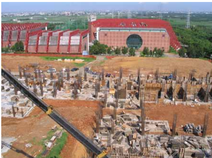
理學院二期工程近期進度照 94.08.15