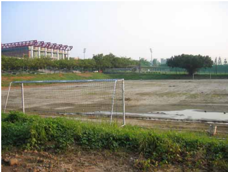
原先體育館前的壘球場改建為足球場 (94.09.05 攝)